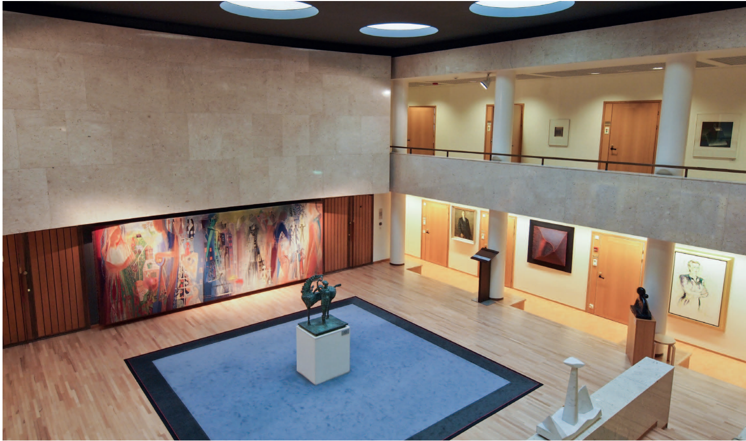
Vuonna 1961 valmistuneen pääkonttorin laajennusosan Marmoriaula.