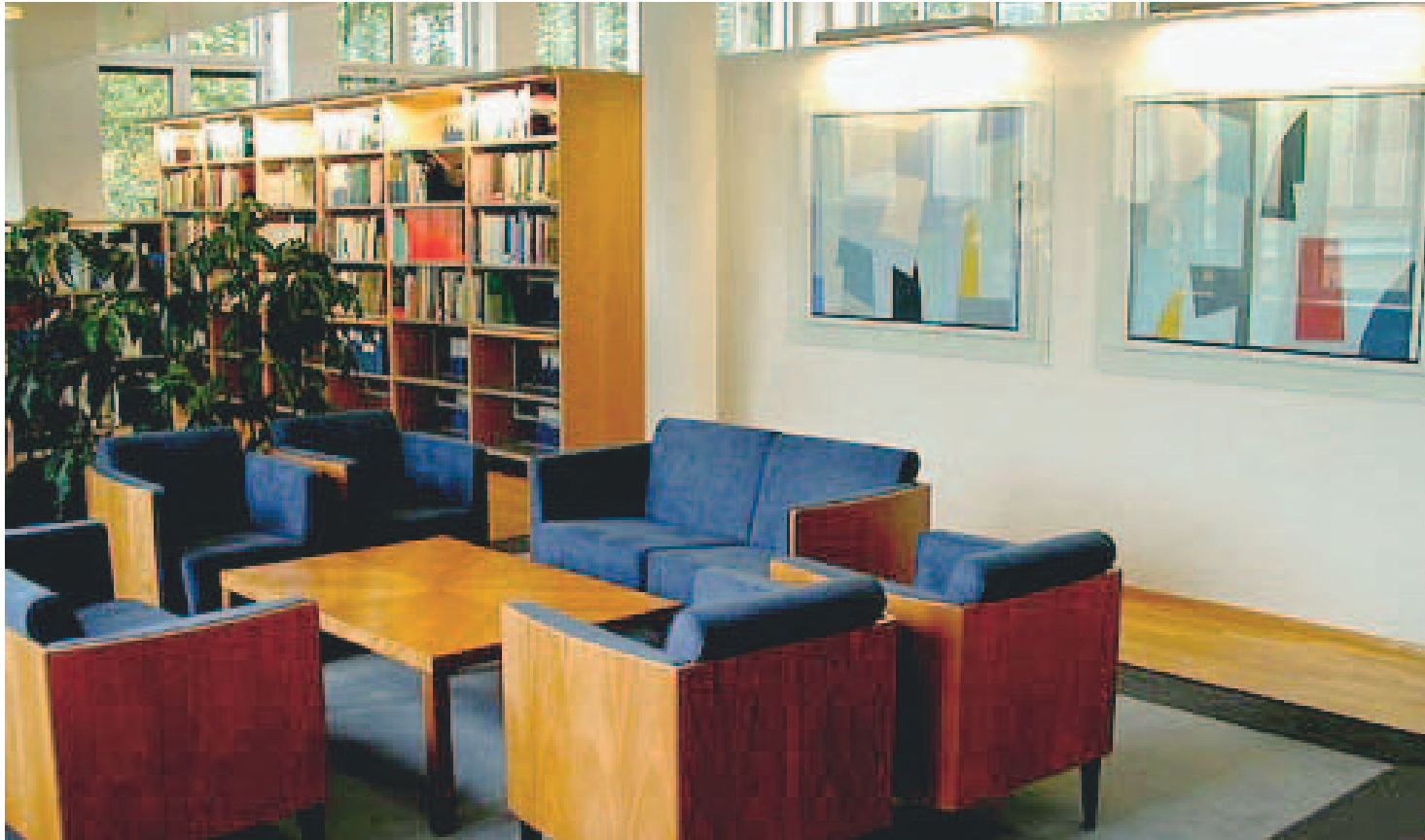
Näkymä kirjastosta vuodelta 2001.