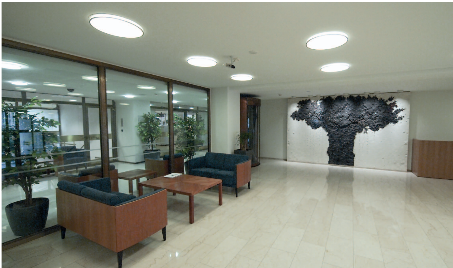
Rauhankatu 19:ssä sijaitsevan toimistotalon aulaa kaunistaa Rut Brykin Puu vuodelta 1980.