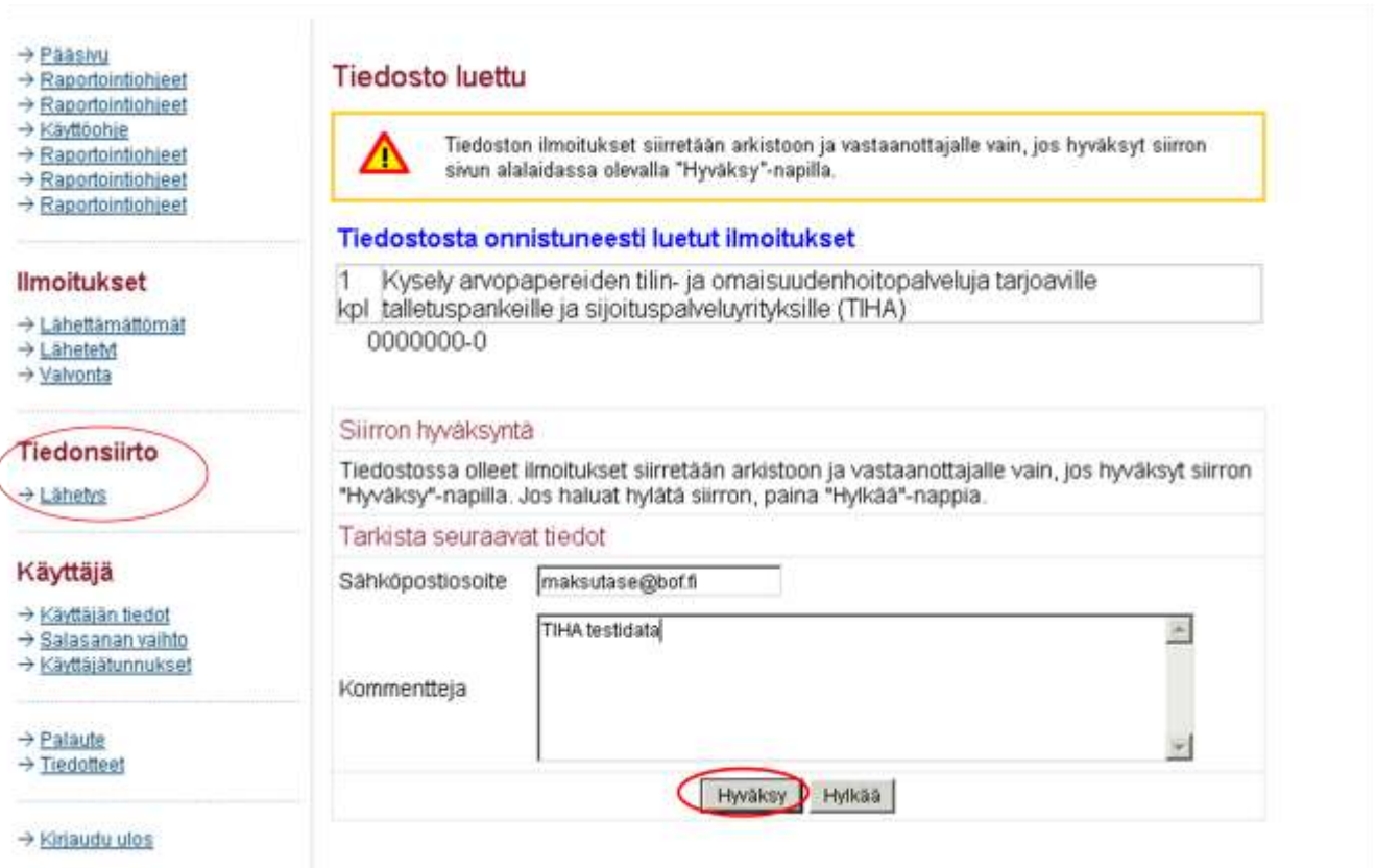
Kuva 5. Tiedoston sisänluku.