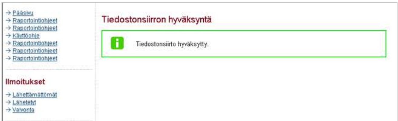
Kuva 6. Kuittaus tiedonsiirron onnistumisesta.